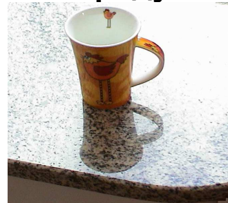
Фото. 3. Гранитная плита, импрегнированная «на блеск». Прекрасная охрана от загрязнения.

1-вылитая смола, 2-слой песка, через который проникла смола и качественно связала его, 3-песок с водой, которая была вытолкана проникающей смолой.