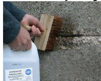
Фото 2. Насыщение бетона вокруг арматуры, имеющей тонкий защитный слой. Далее наносится недостающий слой ремонтного раствора.