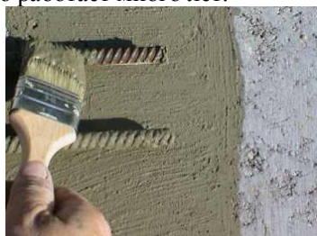
Фото 1. Пассивация поверхности арматуры совмещается с нанесением сцепляемого слоя на сталь и на бетон

Hygrostop-Пассивный является водным раствором ингибиторов коррозии, добавок, улучшающих проникновение в поры бетона/стали, а также добавок ускоряющих вязание и твердение. Проникающее действие состоит на диффузном распространении материала в порах раствора или бетона и на поверхности стали. При контакте с поверхностью стали, наступает многосторонняя блокада коррозии. Материал не испаряется и эффективно работает много лет.