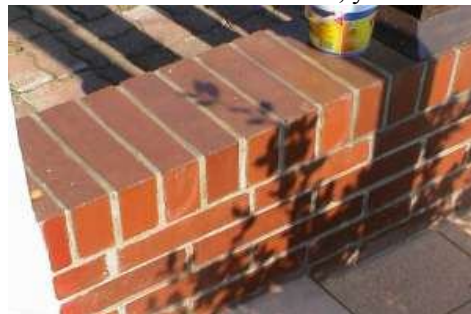
Фото 1: Стенка обработанная Hygrostop-Прозрачным

Цвет поверхности после импрегнации становится более выразительным, а поверхность создает впечатление обновленной, умытой.